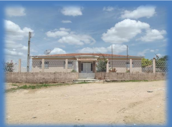
Figura 16: Sede do Projeto Solidariiedade, em janeiro de 2013.