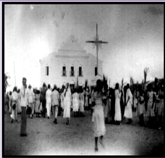
Figura 1: Capela de Santa Rita de Cássia, nas festividades do domingo de ramos do ano de 1925, vendo o Cruzeiro e o seu largo. Fonte: Acervo da Paróquia.

A Capela do início do Século XX, dedicada a Santa Rita de Cássia e subordinada a freguesia de Piancó, transformou-se em Curato em 02 de março de 1941, e foi elevada a categoria de Paróquia, em 13 de janeiro de 1956, por Decreto especial do Reverendíssimo Senhor Bispo Diocesano de Cajazeiras Dom Zacarias Rolim de Moura, apresentado-se hoje como uma Paróquia arrojada com um patrimônio físico e espiritual consideráveis.