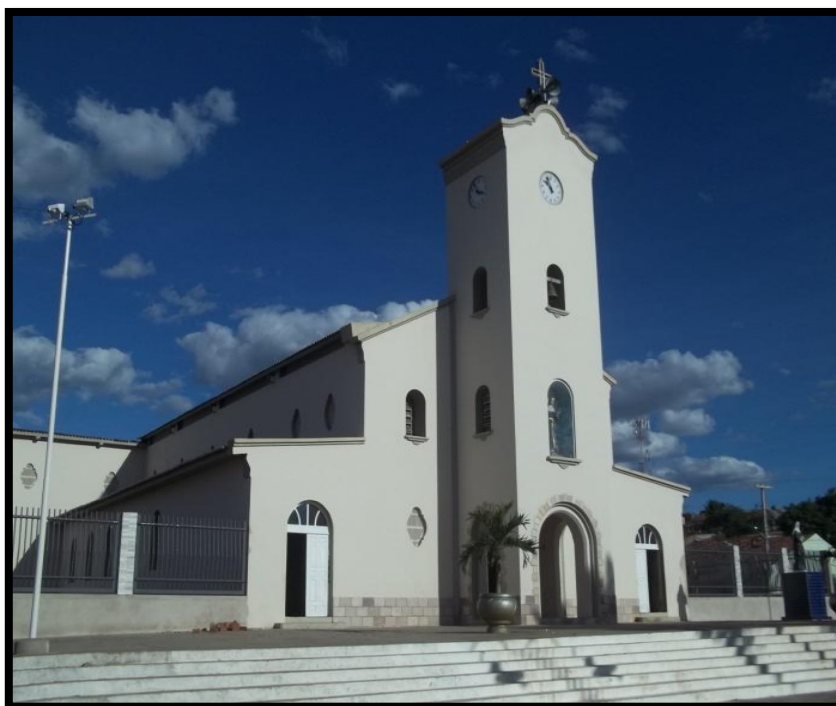
Figura 9: Igreja-Matriz após a reforma do jardim.

Além da reforma do jardim o Padre mandou restaurar todo o acervo de imagens da Igreja-Matriz e das Capelas, com destaque especial para as imagens em tamanho natural adquiridas no Rio de Janeiro, pelo Padre Pedro Luz Cunha, no ano de 1942: Senhor dos Passos, Senhor Morto e Nossa Senhora das Lágrimas.