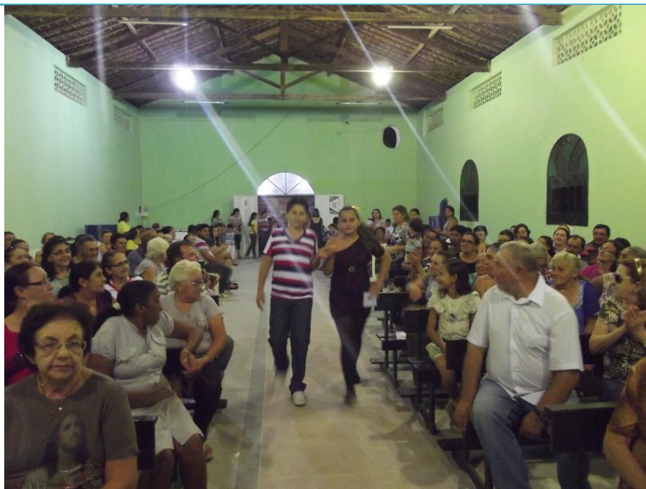
Figura 13: Interior da Capela de Santo Frei Antonio Galvão, na comunidade de Pombalzinho, vendose o piso recém construído.

Na Capela de Santo Frei Antonio Galvão, de Pombalzinho, com a colaboração da comunidade, foi construído o piso novo, em granilite, tudo feito com recursos próprios, além da aquisição de um sino, também doação de dois colaboradores daquela comunidade.