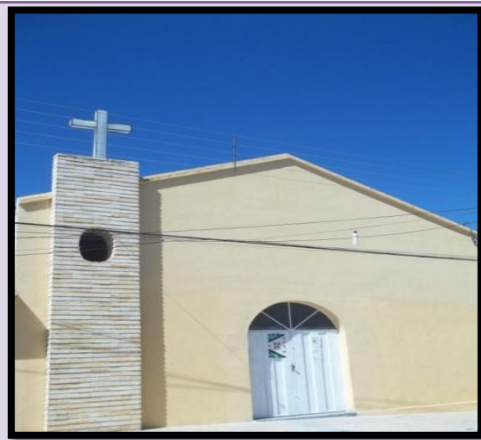
Figura 5: Capela de Santo Frei Antonio Galvão na comunidade de Pombalzinho, em 2012.