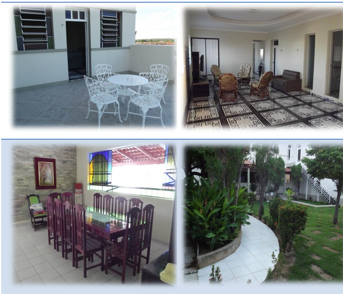
Figura 10: Casa Paroquial (terraço e salão de recepção do piso superior; sala de jantar no térreo e jardim vendo-se, ao fundo, a escada externa de acesso ao piso superior, recém construída.