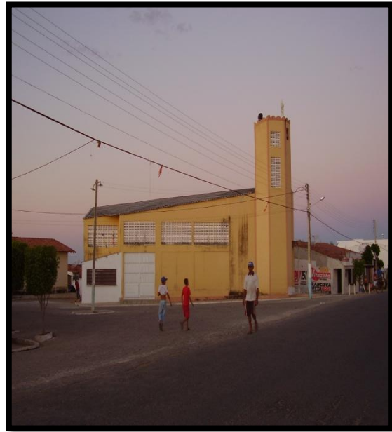
Figura 3: Capela de São Pedro e São Paulo na