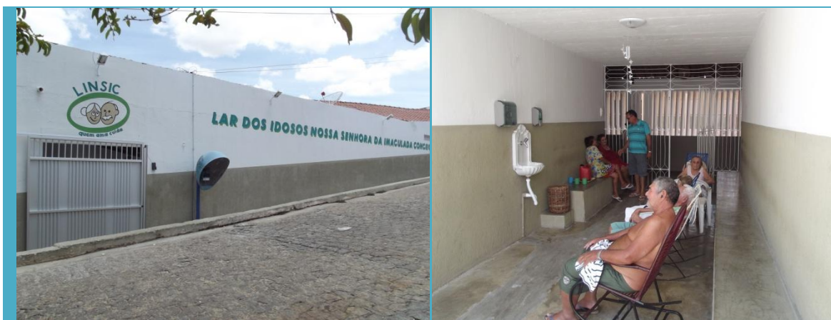
Figura 14: Fachada e hall interno do Lar dos Idosos N. S. da Imaculada Conceição.

doações, em maio de 2012, a Associação dos Idosos ocupou o novo espaço, conforme fotos abaixo.