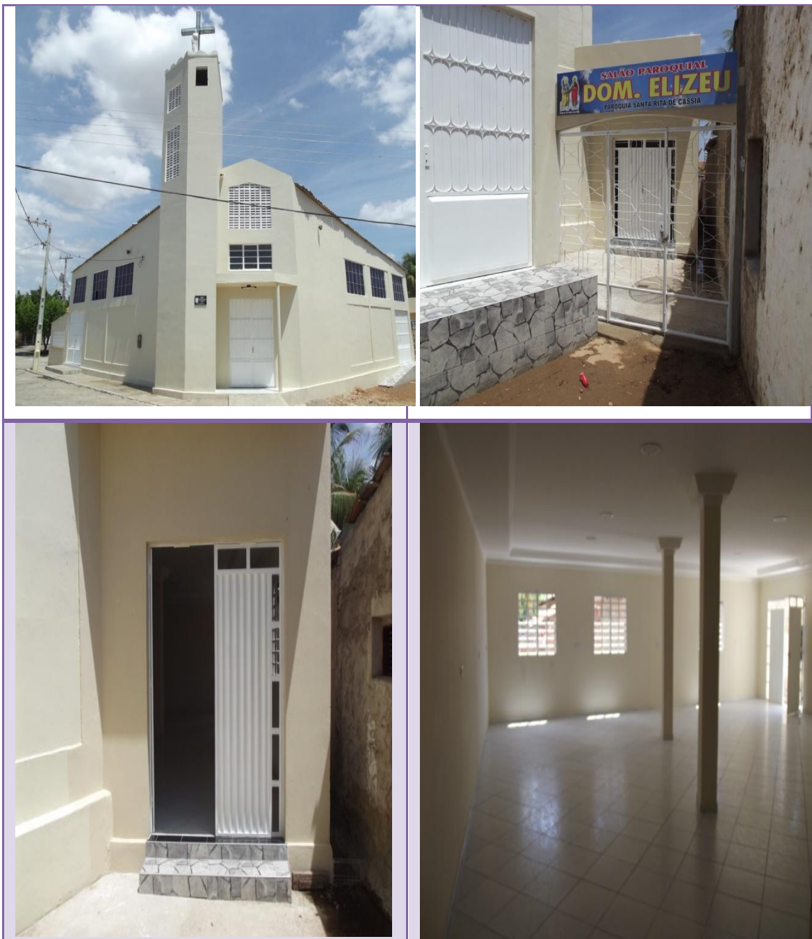
Figura12: Capela de São Pedro e São Paulo e vista externa e interna do Salão Paroquial Dom Elizeu.