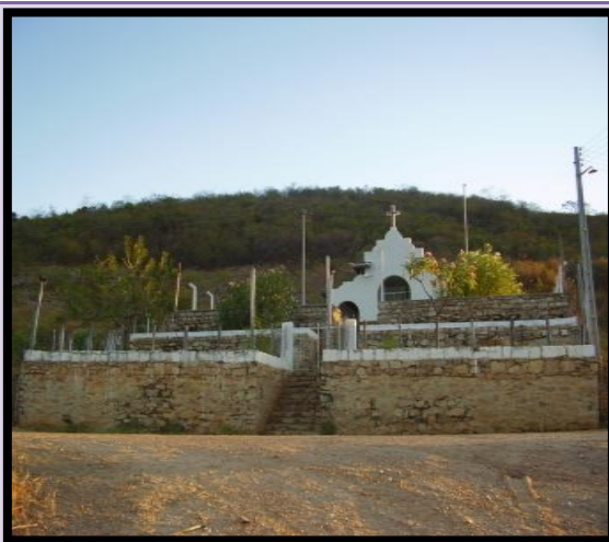
Figura 4: Capela de Santa Terezinha, na Comunidade do DNOCS.