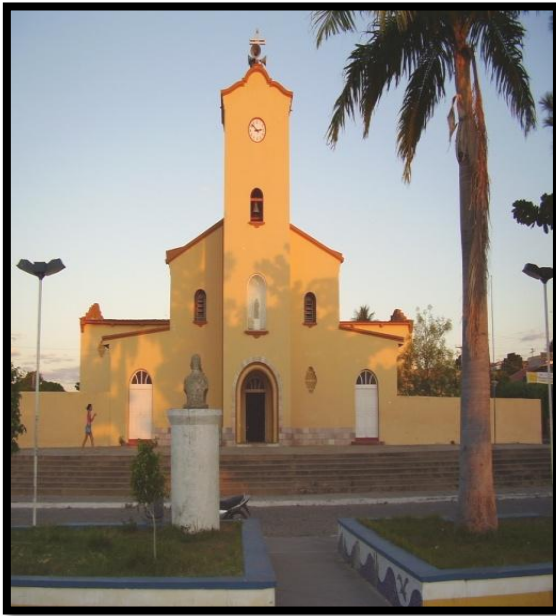
Figura 2: Igreja Matriz, em 2006.

Desde o início do Curato muitos padres foram nomeados pela Diocese de Cajazeiras para administrar a Paróquia de Santa Rita de Cássia. O trabalho dos diversos administradores e dos fiéis de muitas gerações transformou o Templo modesto do início do Século XX, na belíssima Igreja-Matriz do início do Século XXI, com várias capelas no perímetro urbano, inúmeras capelas nas comunidades rurais, o Centro de Pastoral João Paulo II, a Casa Paroquial, o Salão Paroquial Padre Guilherme Touw, e muitos outros imóveis.