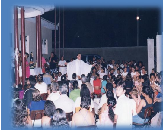
Figura 15: Sede do Projeto Solidariiedade na festa de inauguração, em 1997.