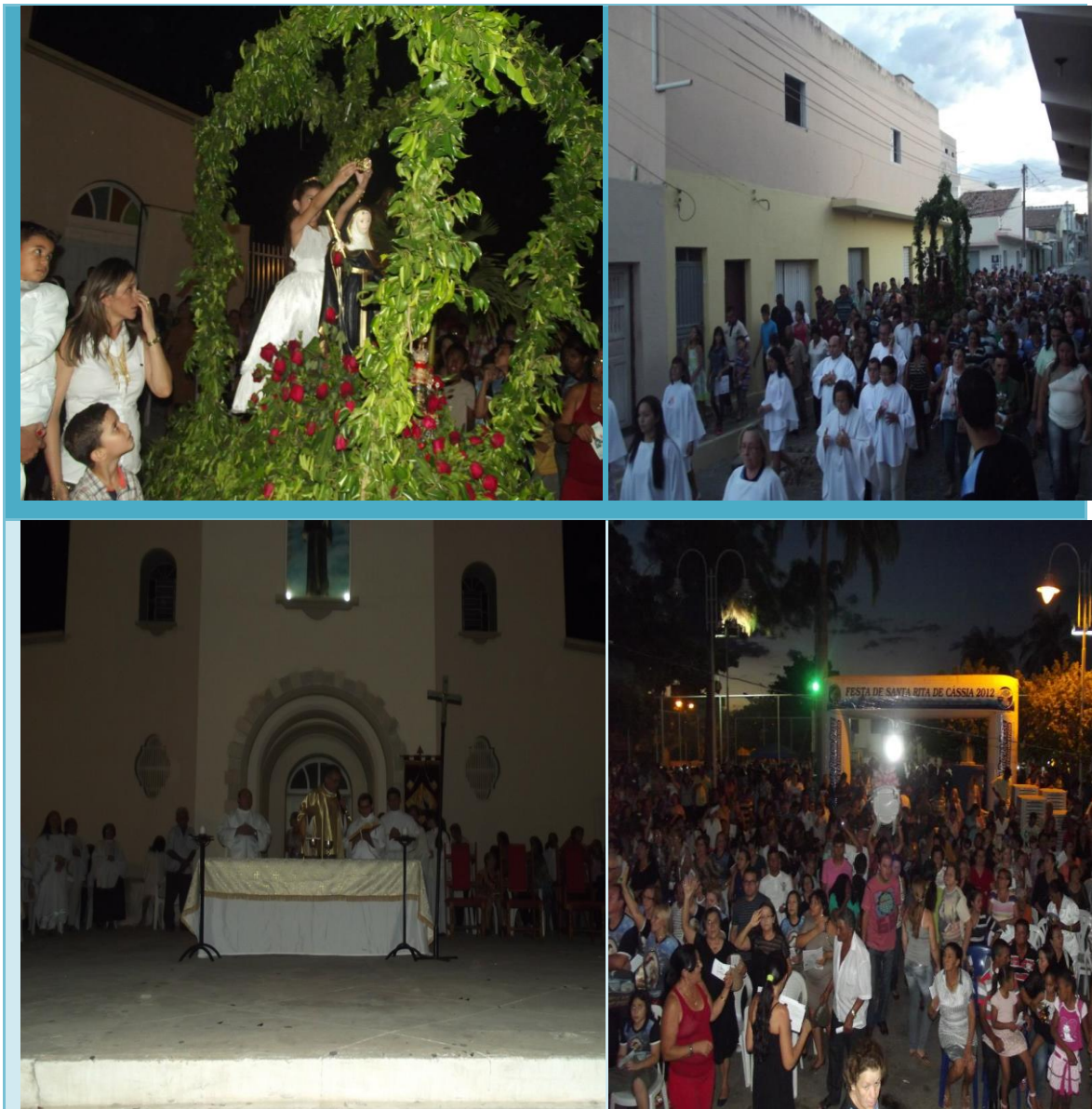
Figura 17: Solenidades de Encerramento da Festa de Santa Rita de Cássia do ano de 2012.

A Campanha da fraternidade de 2012 com o tema “Fraternidade e Saúde Pública” e o lema “Que a saúde se difunda sobre a terra” foi trabalhada junto a comunidade em parceria com as secretarias municipais de saúde e da educação, com os estabelecimento de ensino particular, no programa radiofônico da paróquia através de entrevistas com especialistas nas áreas da saúde e da educação.