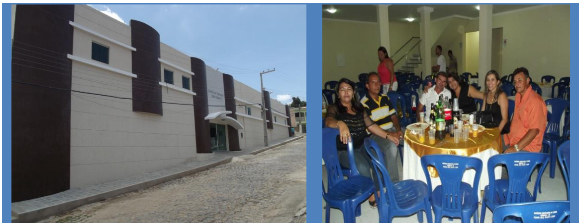
Figura 11: Fachada do Centro de Pastoral João Paulo II e flagrante da festa de inauguração, vendo-se, ao fundo, a escada de acesso ao piso superior.