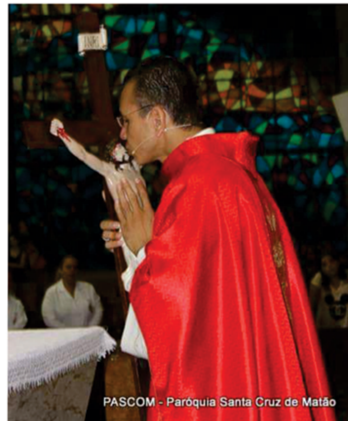
PASCOM - Paróquia Santa Cruz de Matão

E nós, como estamos respondendo a tudo o que Deus tem nos dado? Temos vivido a graça do perdão? Mergulhamos em nossas fragilidades e tomamos posse desta área? Como somos dentro de casa, no trabalho, na comunidade? Nossos